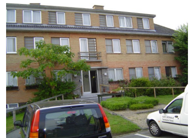
Klaver 4 Oostkamp